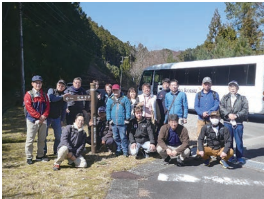
(伏拝口から徒歩での出発)