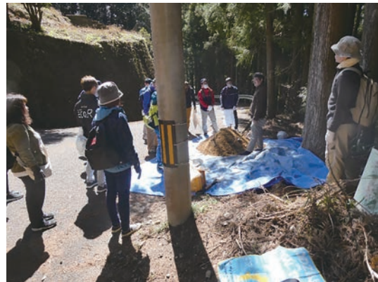
(1トンの土を前に説明を受ける様子)