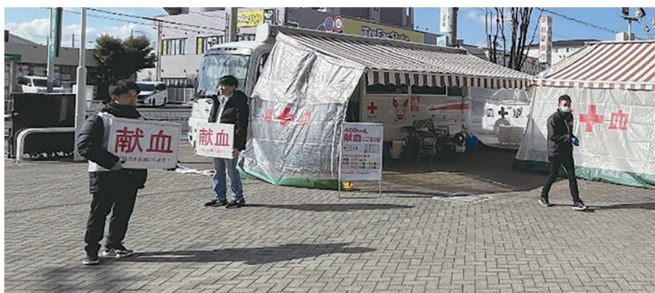
イオンモール堺北花田

総勢128名の受付、108名の採血、8名の骨髄バンク登録となり、たくさんの方に献血へのご協力を頂くことが出来ました。アクトメンバー一同、心より感謝を申し上げます。有難うございました。