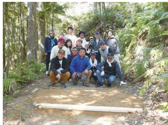
(数か所をダンチク風に突き固めた後)