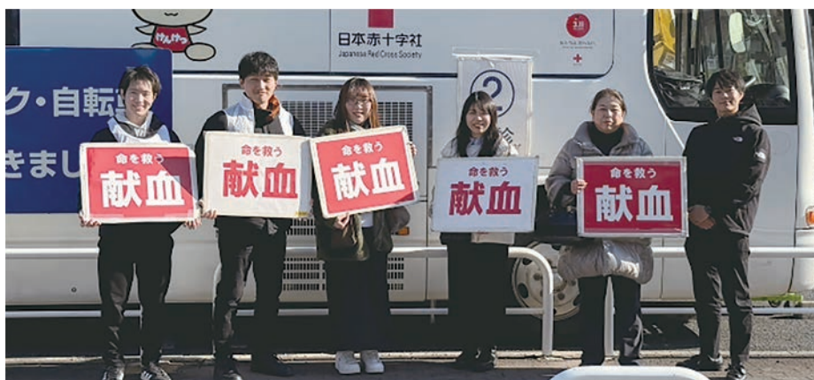
いこらも～る泉佐野