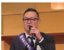
ホストクラブ 堂西会長