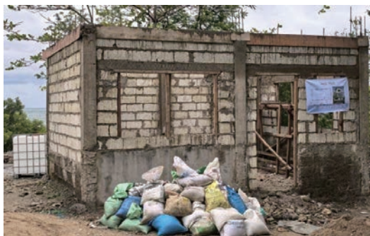
1か月後(3月20日現在)の進捗状況