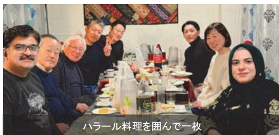
ハラル料理を囲んで一枚

現在までに、米山奨学生の累計出身地は134の国と地域に及び、それぞれが異なる宗教や文化、価値観を持っています。今回は、米山奨学生とロータリー会員の相互理解を深める取り組みをご紹介します。