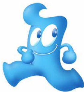
↑マスコットキャラクター