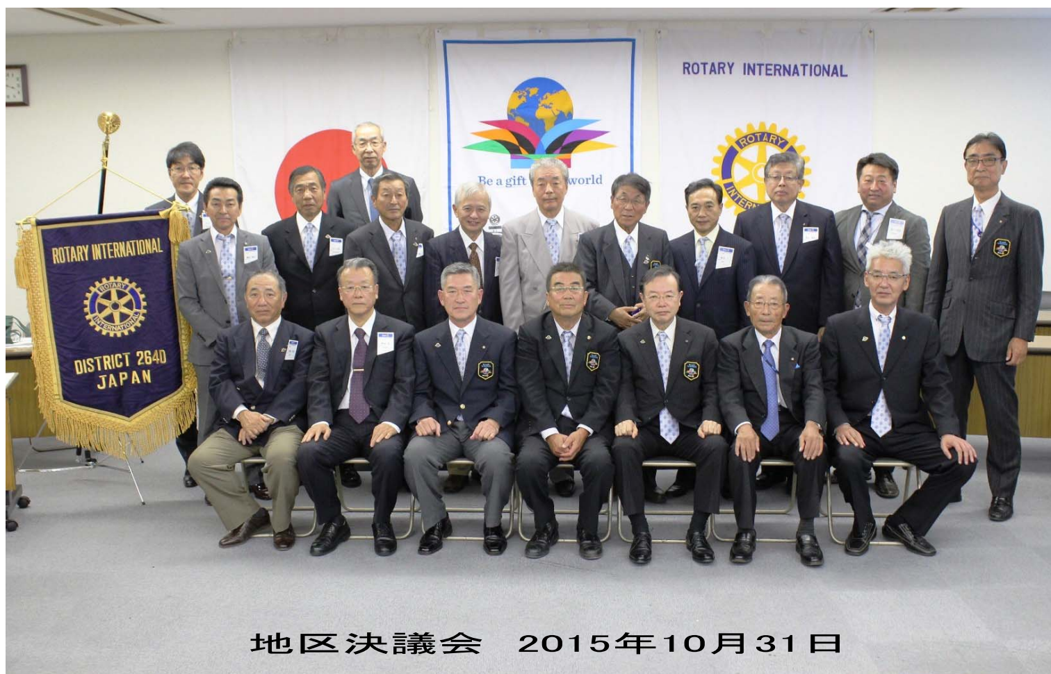
地区決議会 2015年10月31日