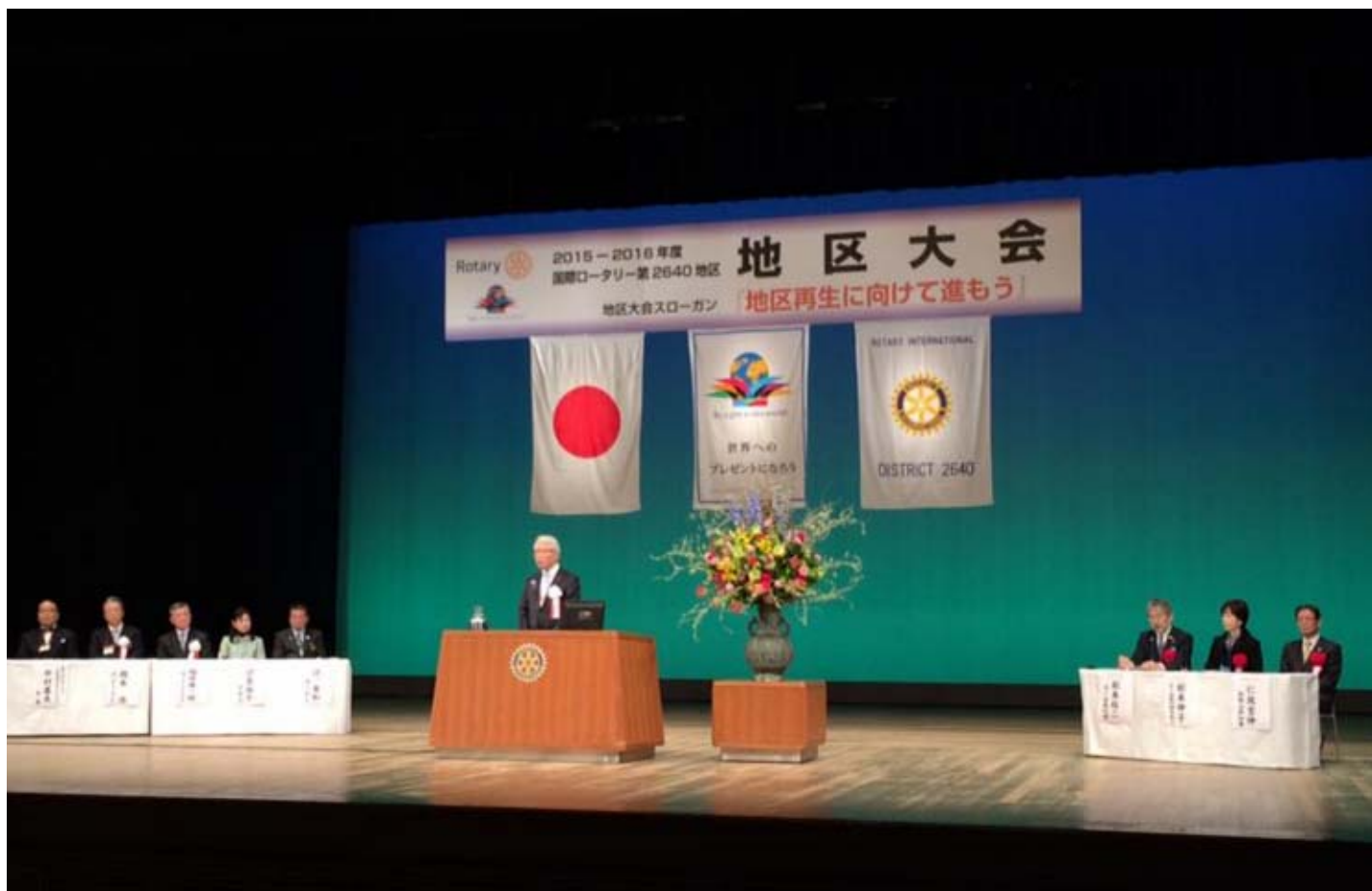
2015-2016 年度 国際ロータリー第 2640 地区「地区大会」 和歌山市