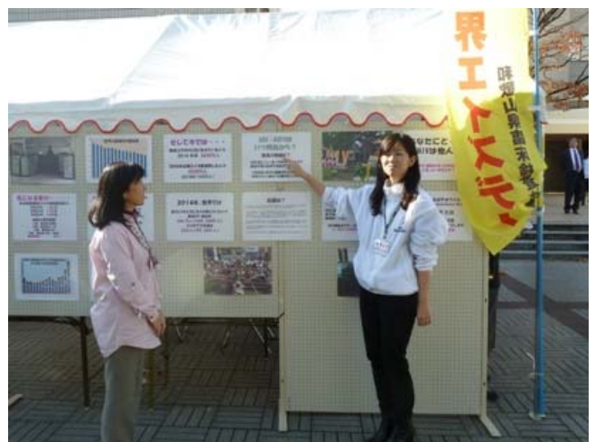
エイズデータの説明・臨床衛生検査技師会