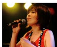
ワンナイト ライブ 宝子