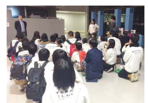
12月26日PM 台湾新竹RID3500地区との交流会