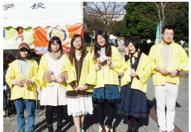
中国の留学生も参加してくれました。