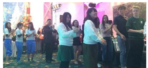
12月25日PM 台湾台中RID3460地区との交流会 台中RID3460地区IAC学生と世界27か国からの交換留学生と楽しく思い出に残るクリスマス交流を過ごしました。