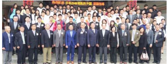
12月26日AM 台湾台中RID3460地区との交流会 台中青年高中(高校)に新設のIAC認証伝達式参加