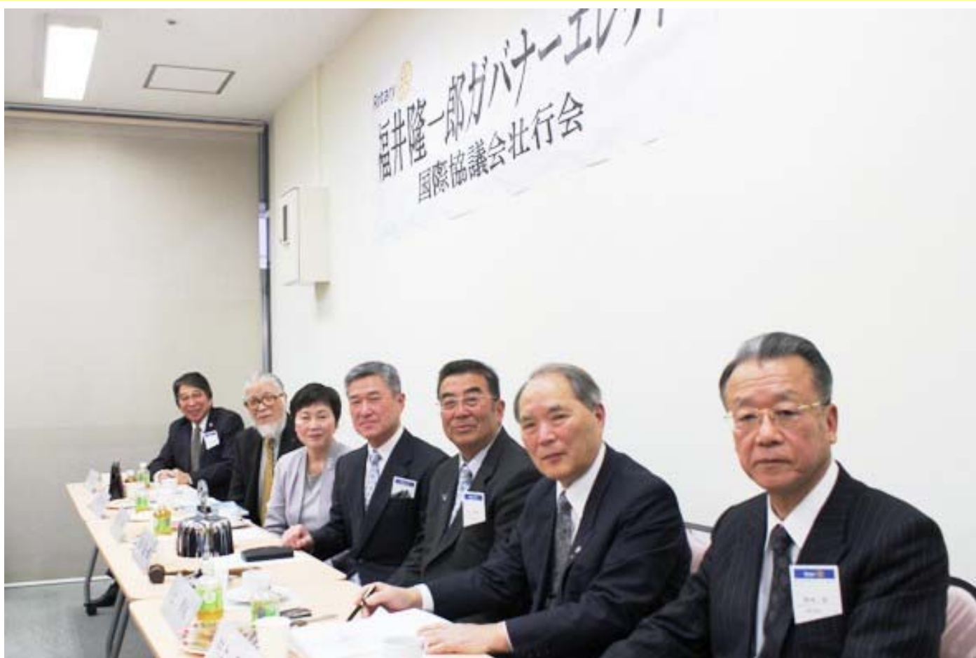
福井ガバナーエレクトの国際協議会 壮行会 2015年12月20日 ポルタス・センタービル1階