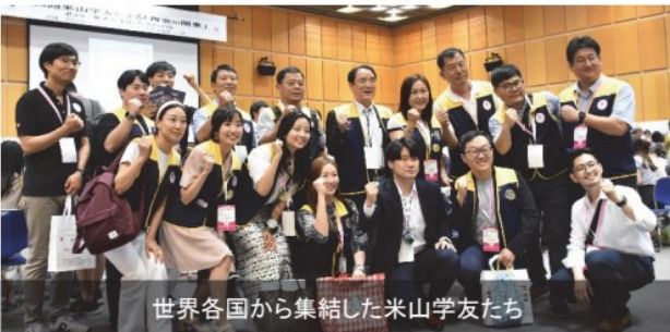
世界各国から集結した米山学友たち

第3回米山学友による世界大会「再会 in 関東」（主催：関東10地区米山学友会）が8月5日、つくば市国際会議場で開催されました。また、前日には前夜祭、6日にはつくば市内で文化体験バスツアーが行われました。今回つくば市が開催地となった背景に、世界最大級のサイエンスシティが、勉学を目的に来日した経験を持つ米山学友が集うのに相応しい都市であるだけでなく、東日本大震災の被災地でもある地で大きな集いを開催することで、地域貢献・活性化に繋がりたい、という実行委員会の思いがあります。その思いの通り、世界38カ国の米山学友と現役奨学生638人、ロータリアン447人、その他家族などを含め、登録者数は総勢1,209人となり、広い会場は超満員となりました。