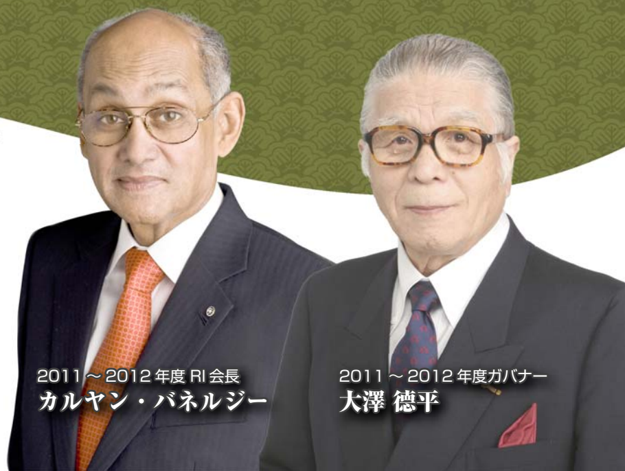
2011～2012年度RI会長 カルヤン・パネルジー