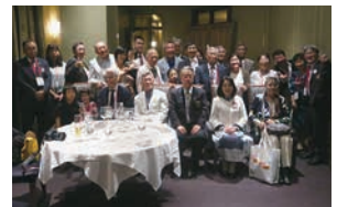
（ジャパンナイト参加者）