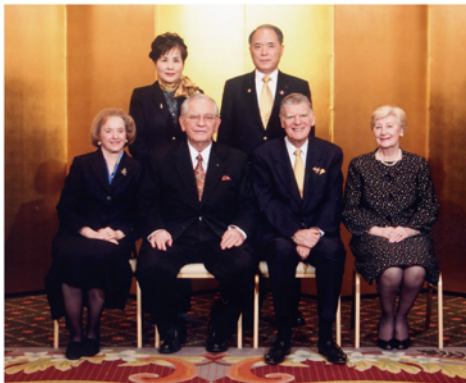
(ロータリー研究会にて)

◎現行のロータリー綱領は、1951年(昭和26年)に改正されたものである。その第4項に「奉仕の理想に結ばれた事業と専門職務に携わる人の世界的親交によって、国際間の理解と親善と平和を推進すること」との定めがある。ロータリアンは、その実践に努め、世界平和に寄与する行動義務がある(RI定款第4条、標準クラブ定款第5条)。