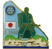
本年度地区バッジ (井慶)